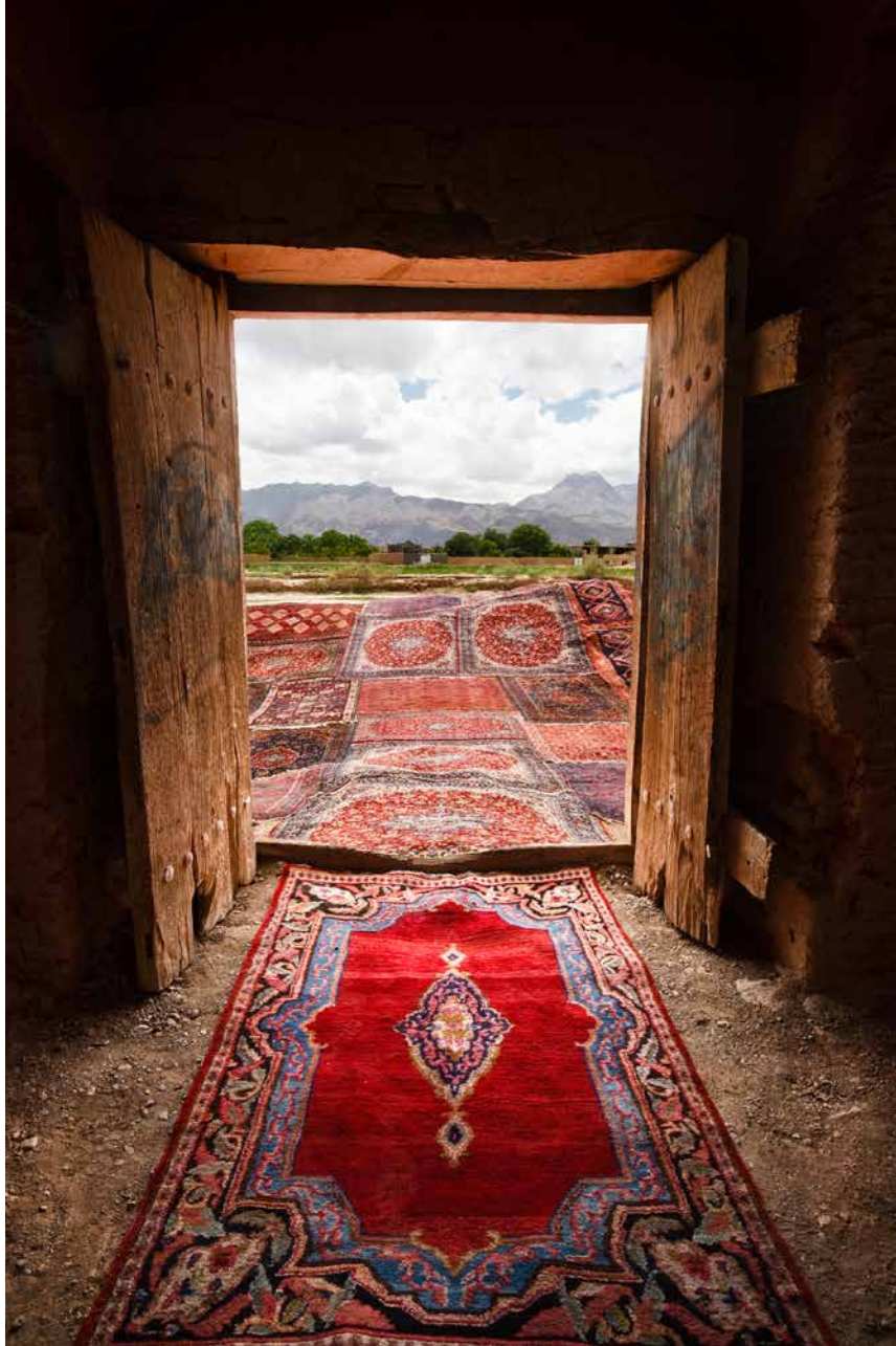
Jalal Sepehr, série Knot , 2011 Photographie numérique, 100 x 70 cm Edition EA/2