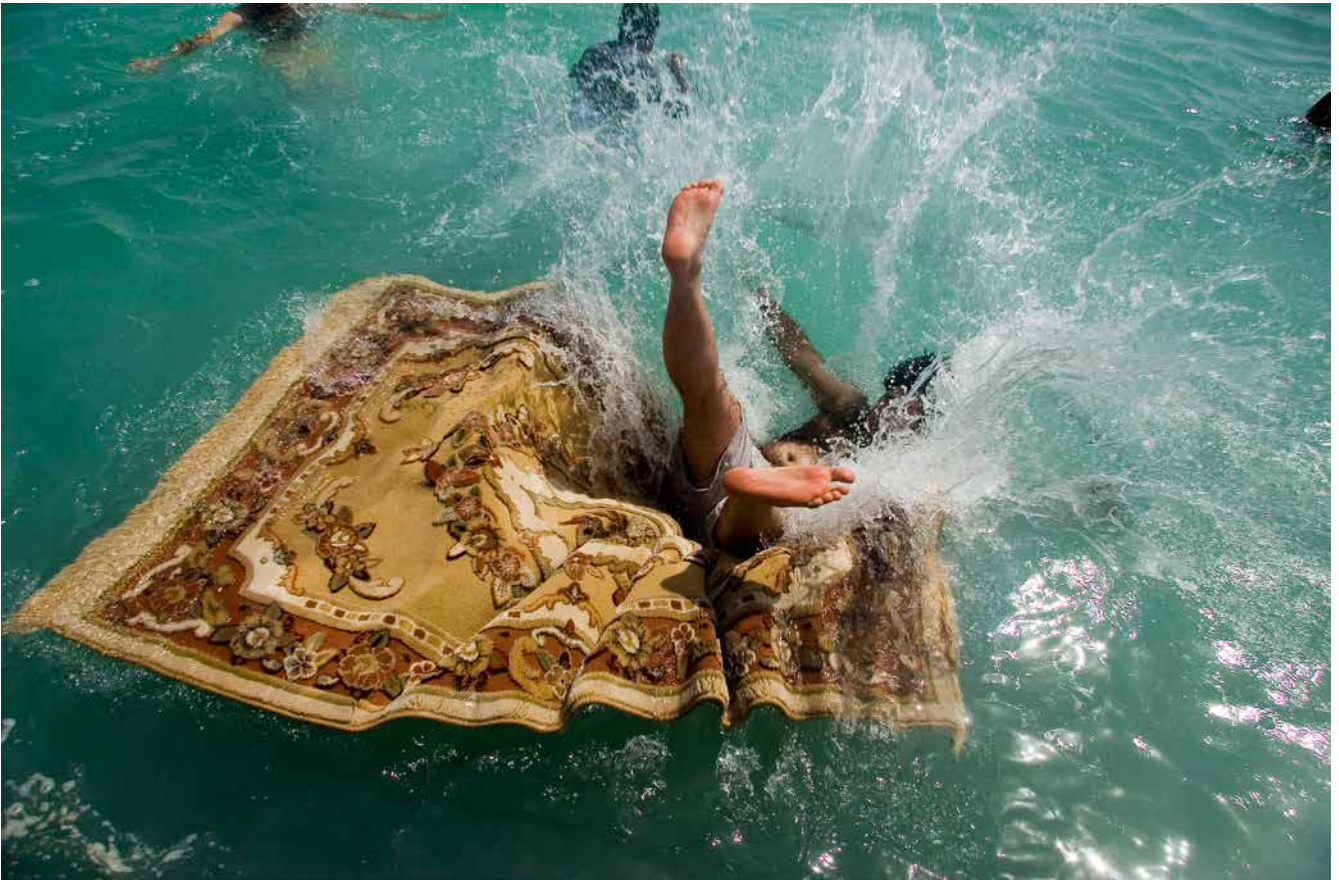
Jalal Sepehr, série Water and Persian Rugs , 2004 Photographie numérique, 70 x100 cm Edition 6/10