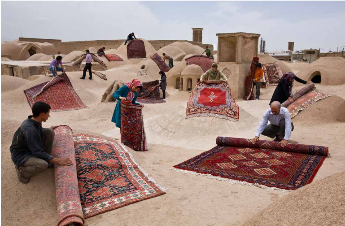
Jalal Sepehr, série Knot , 2011 Photographie numérique, 70 x 100 cm Edition 6/7