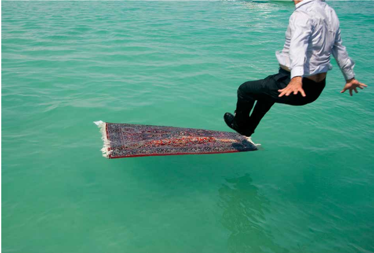
Jalal Sepehr, série Water and Persian Rugs , 2004 Photographie numérique, 70 x100 cm Edition 6/10